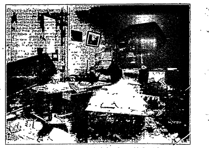
Secretaría de la Confederación Obrera Regional Argentina y del Comité Pro Presos

Un documento curioso e interesante para los apurados lectores por el análisis de nuestro libro sobre las relaciones exterior e interior del libro "Papeles de Fierro" del cual se exhiben muchos ejemplares en nuestra librería.